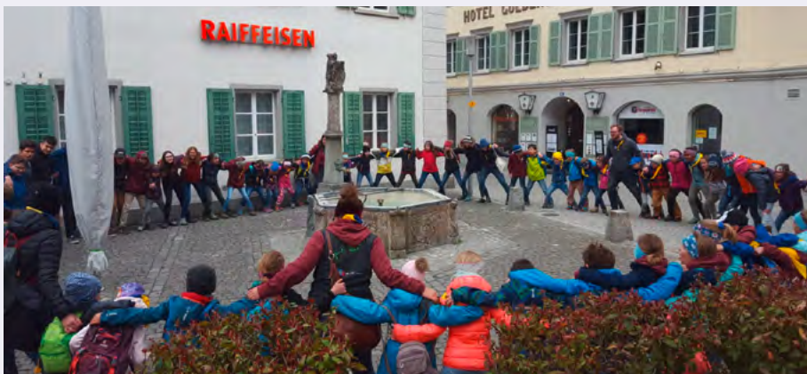
Die Pfadikinder genossen den Nachmittag in Altdorf

Mit einem Rucksack und dem Equipment zum Lösen der Aufgaben machten sie sich auf den Weg. Mithilfe von Armbrust, Feldstecher, Regenschirm und weiteren Hilfsmitteln lösten die Pfadikinder die verschiedenen Rätsel und machten sich am Abend glücklich wieder auf den Weg nach Erstfeld.